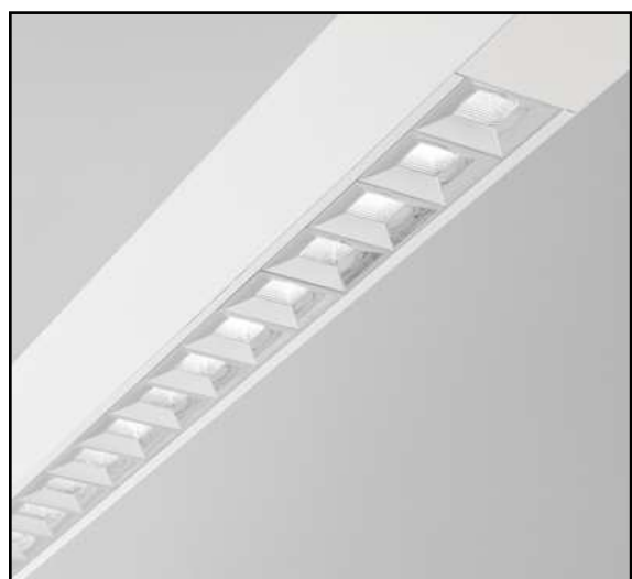
Modulo riflettori inserito nel profilo vuoto